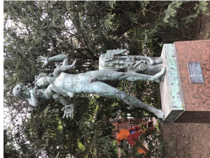
Satyr med Bacchusbarn