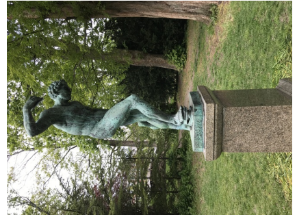
Satyr med klangbækkener.