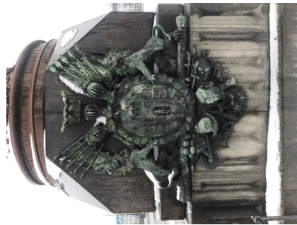
Byvåben på Dronning Louises bro. Nørrebro siden mod øst