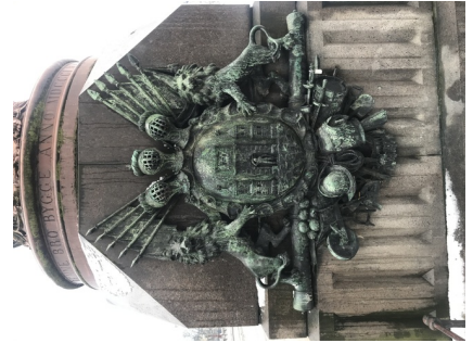
Bysiden mod vest