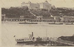
Das große Hotel Palais imp royal à Brno