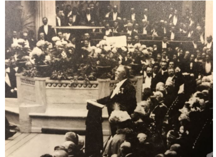
1897-05-01 CJ taler, udsnit