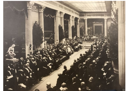
Åbning af Den internationale Udstilling 1897.