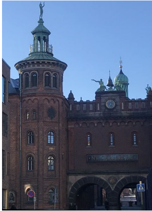
Adoranten på toppen af hjørnetårnet på Ny Carlsberg