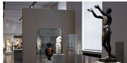
Bedende yngling. Altes Museum Berlin