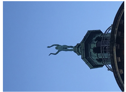
Adoranten på toppen af hjørnetårnet på Ny Carlsberg