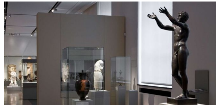
Bedende yngling. Altes Museum Berlin