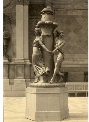
1913. Fodstykke til flagmast opstillet foran Glyptoteket