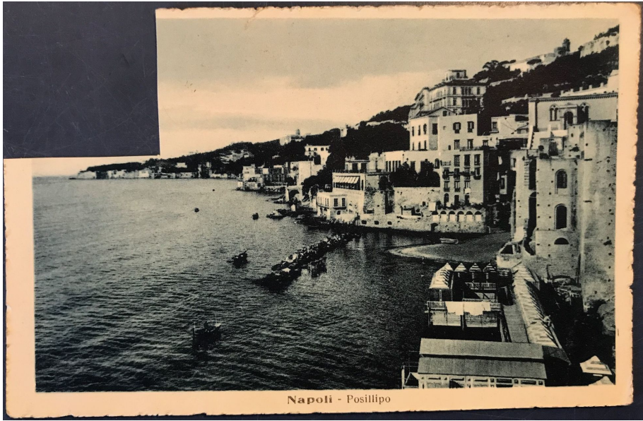
Napoli - Posillipo