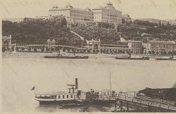
Das große Hotel Palais imp royal à Brno.