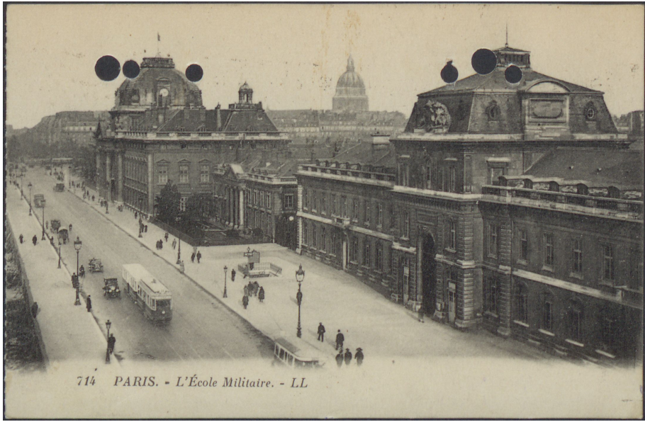
714 PARIS. - L'École Militaire. - LL