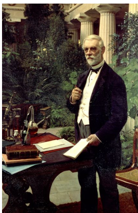
August Jerndorff, J.C. Jacobsen 1886