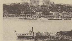
View taken from the boat Castle of St. Stephen of Hungary