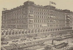
Budapest. 4 August 1890