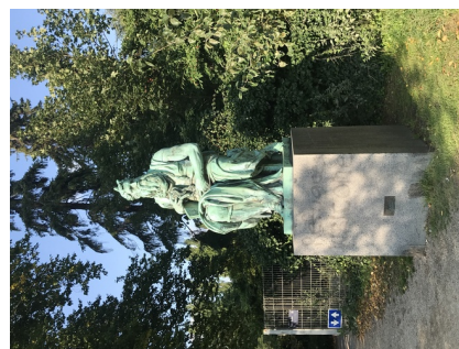
Moses af Michelangelo Buonaroti. Hans Tavsens Park, København.