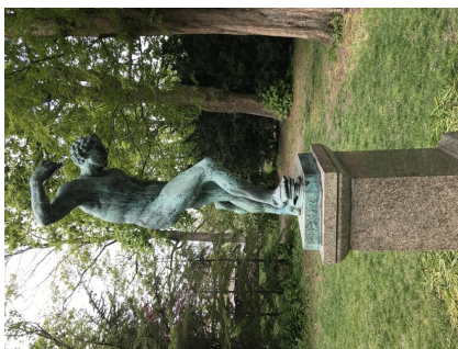
Satyr med klangbækkener. Opstillet 1886 i Ørstedsparken.