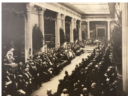
1897-05-01 CJ taler