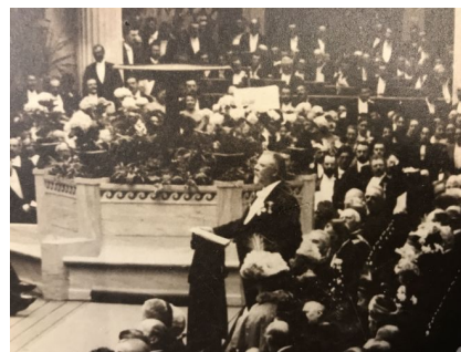
1897-05-01 CJ taler, udsnit