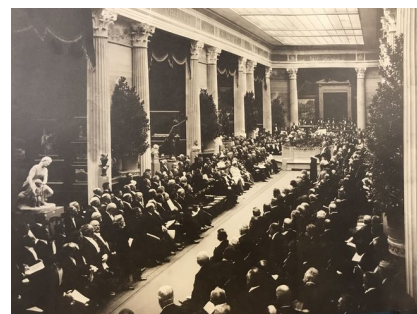
Åbning af Den internationale Udstilling 1897.